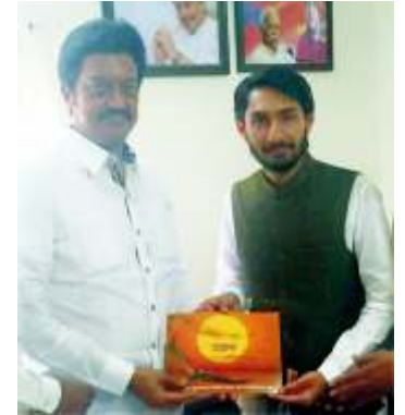
मा. श्री. अनिल शिरोळेजी सांसद, लोकसभा