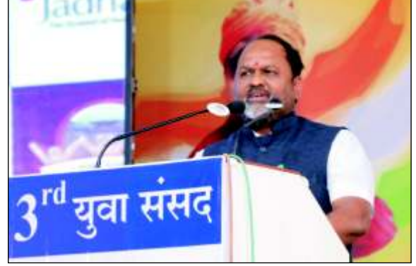
मा. श्री. महादेव जानकर – कैबिनेट मंत्री (महाराष्ट्र राज्य)