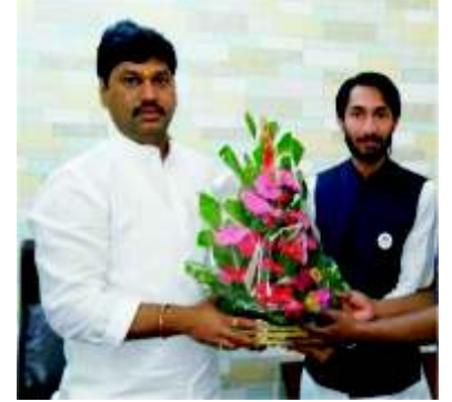
मा. श्री. धनंजय मुंडेजी विरोधी पक्ष नेता (विधान परिषद), महाराष्ट्र राज्य