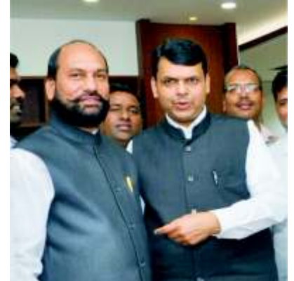
मा. श्री. देवेंद्र फडणवीसजी मुख्यमंत्री, महाराष्ट्र राज्य