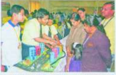
पुणे, डॉ. सुभाकर जाधवर कला, साहित्य आणि विज्ञान महाविद्यालय व राष्ट्रीय सेवा योजने व राष्ट्रीय विज्ञान परिषद पुणे विभाग वरध्व सयुक्त विद्यमाने 'जाधवर सायन्स फेअर २०१९' या राज्यस्तरीय विज्ञान प्रदर्शनाचे आयोजन करण्यात आले. यावेळी प्रदर्शनातील प्रकल्प घेऊन विद्यार्थी...