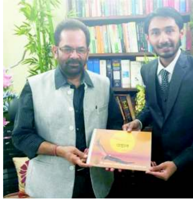
मा. श्री. मुख्तार अब्बास नकवीजी केन्द्रीय अल्पसंख्यांक मंत्री