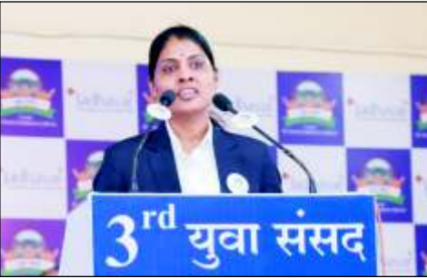
मा. श्रीमती ललिता बाबर (आशिया की सर्वोत्कृष्ट रनर)