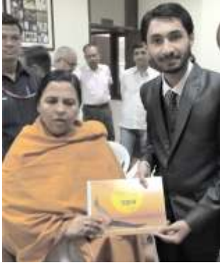
मा. सु.श्री. उमा भारतीजी केन्द्रीय जल संसाधन, नदी विकास और गंगा सफाई मंत्री