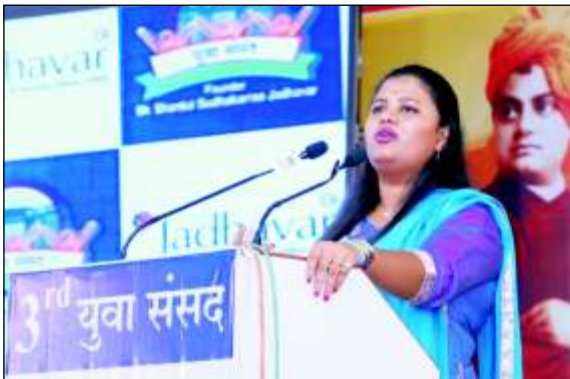
मा. डॉ. हीना गावीत – सांसद (नंदूरबार लोकसभा मतदार संघ)