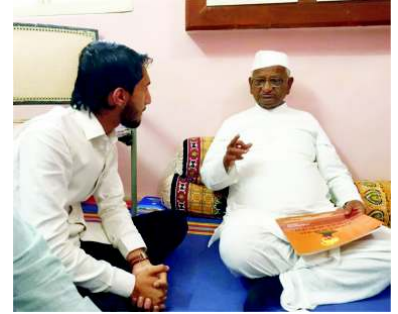
पद्मभूषित मा. श्री. अण्णा हजारेजी