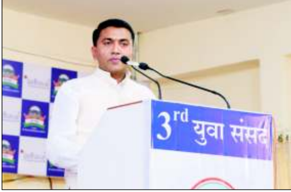
मा. डॉ. श्री. प्रमोद सावंत (मुख्यमंत्री, गोवा राज्य)