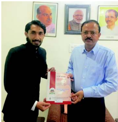
मा. श्री. सुभाष भामरेजी रक्षा राज्यमंत्री भारत सरकार