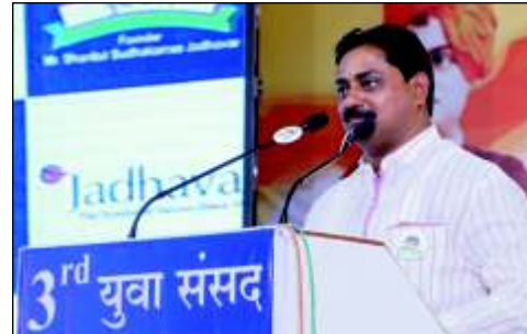
मा. श्री. संग्रामदादा थोपटे - विधायक (महाराष्ट्र विधानसभा)