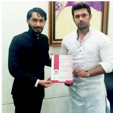
मा. श्री. चिराग पासवानजी सांसद (लोकसभा)