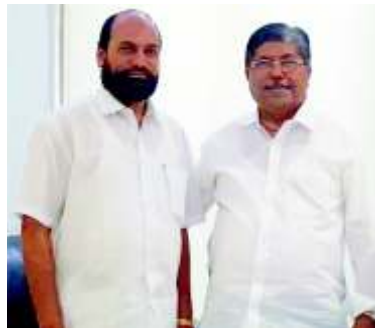
मा. श्री. चंद्रकांत बच्चू पाटीलजी महसूल, मदत व पुनर्वसन, सार्वजनिक बांधकाम मंत्री, महाराष्ट्र राज्य