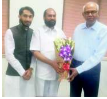
पद्म विभूषण मा. श्री. रघुनाथ माशेलकरजी