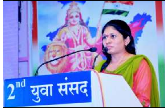
मा. रक्षाताई खडसे - सांसद (रावेर लोकसभा मतदार संघ)