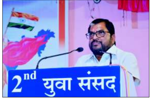
मा. श्री. राजू शेटी - सांसद (अध्यक्ष, शेतकरी स्वाभिमानी संघटना)