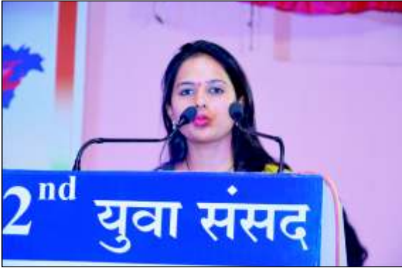
मा. प्रितमताई मुंडे - सांसद (बीड लोकसभा मतदार संघ)