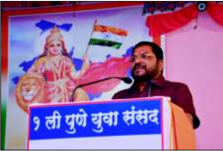
मा. श्री. राजू शेट्टी (सांसद, लोकसभा)