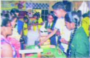
छात्रांनी - नव्यनवीन डॉ. जाधवर महाविद्यालयाच्या राष्ट्रीय सेवा योजने व बराचो विज्ञान परिषद पुणे विभाग वरध्व सयुक्त विद्यमाने 'जाधवर सायन्स फेअर २०१९' या राज्यस्तरीय विज्ञान प्रदर्शनाचे आयोजन केले होते. यावेळी प्रदर्शनातील प्रकल्प घेऊन विद्यार्थी...

डॉ. सुभाकर जाधवर कला, साहित्य आणि विज्ञान महाविद्यालय व विद्यार्थी विकास मंडळ आणि राष्ट्रीय सेवा योजनेच्या संयोजिताने 'जाधवर सायन्स फेअर २०१९' या