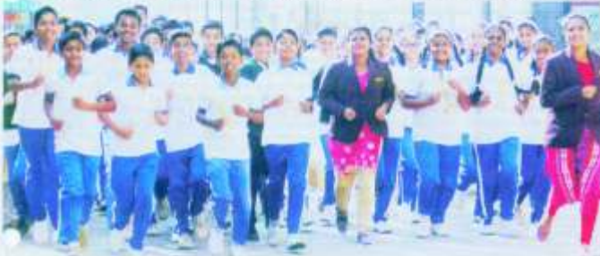
बायली : मॅरेथॉन करताना पुणे ज्योति इंस्टिट्यूटच्या जाधवर स्पोर्ट्स फेस्टिवलमध्ये उपस्थित असलेले विद्यार्थी.

३ मार्च : (पुणे) - पुणे येथील जाधवर स्पोर्ट्स फेस्टिवलमध्ये विद्यार्थ्यांचा सहभाग वाढत चलायला आहे. यावेळी विद्यार्थ्यांच्या मॅरेथॉन स्पर्धाही सुरू झाली. यावेळी विद्यार्थ्यांच्या मॅरेथॉन स्पर्धाही सुरू झाली. यावेळी विद्यार्थ्यांच्या मॅरेथॉन स्पर्धाही सुरू झाली. जाधवर स्पोर्ट्स फेस्टिवलमध्ये विद्यार्थ्यांचा सहभाग वाढत चलायला आहे. यावेळी विद्यार्थ्यांच्या मॅरेथॉन स्पर्धाही सुरू झाली. यावेळी विद्यार्थ्यांच्या मॅरेथॉन स्पर्धाही सुरू झाली.