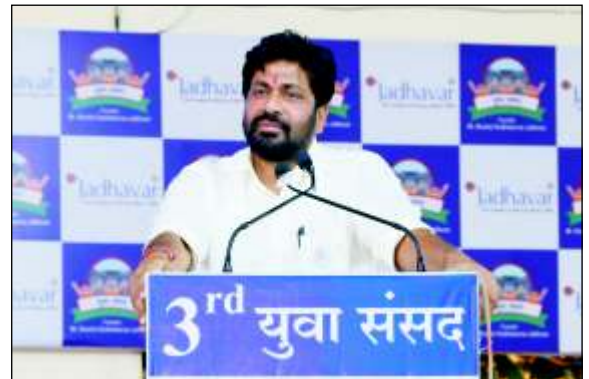
मा. श्री. बच्चू कडू – विधायक (महाराष्ट्र विधानसभा)