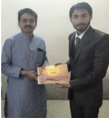
मा. श्री. राजीव सातवजी सांसद एवं राष्ट्रीय युवा कांग्रेस के भूतपूर्व अध्यक्ष