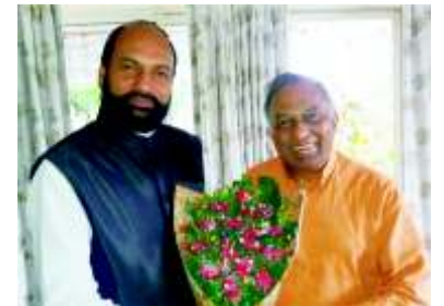
पद्मश्री एवं पद्मभूषण मा. श्री. विजय भटकरजी