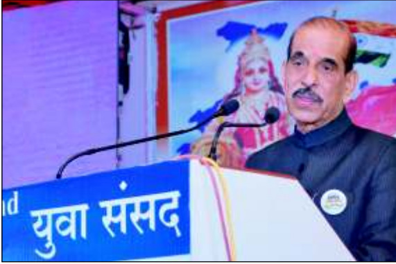
मा. श्री. मनोहररावजी जोशी (सर) (मा. मुख्यमंत्री-महाराष्ट्र राज्य, मा. सभापती-लोकसभा)