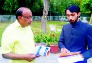
मा. श्री. विजय गोयलजी खेलमंत्री, भारत सरकार