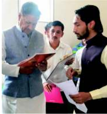
मा. श्री. पृथ्वीराज चव्हाणजी पूर्व मुख्यमंत्री, महाराष्ट्र राज्य