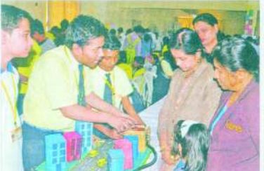
पुणे, डॉ. सुभाकर जाधवर कला, साहित्य आणि विज्ञान महाविद्यालय व राष्ट्रीय सेवा योजने व राष्ट्रीय विज्ञान परिषद पुणे विभाग वरध्व सयुक्त विद्यमाने 'जाधवर सायन्स फेअर २०१९' या राज्यस्तरीय विज्ञान प्रदर्शनाचे आयोजन करण्यात आले. यावेळी प्रदर्शनातील प्रकल्प घेऊन विद्यार्थी...